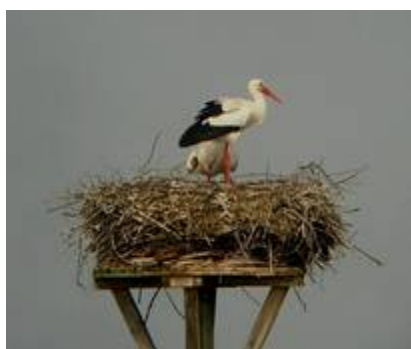
Weißstörche auf ihrem Horst