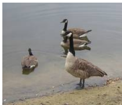
Kanadagänse am Angelweiher